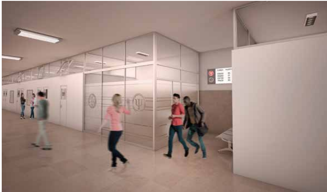
Hall de admisión

S. Freud. Psicología de las masas y análisis del yo