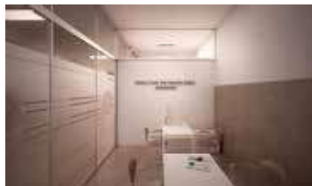
Oficinas de admisión